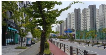
※ 2019.9월 현재 성업중